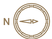
צפון, מערב, מזרח