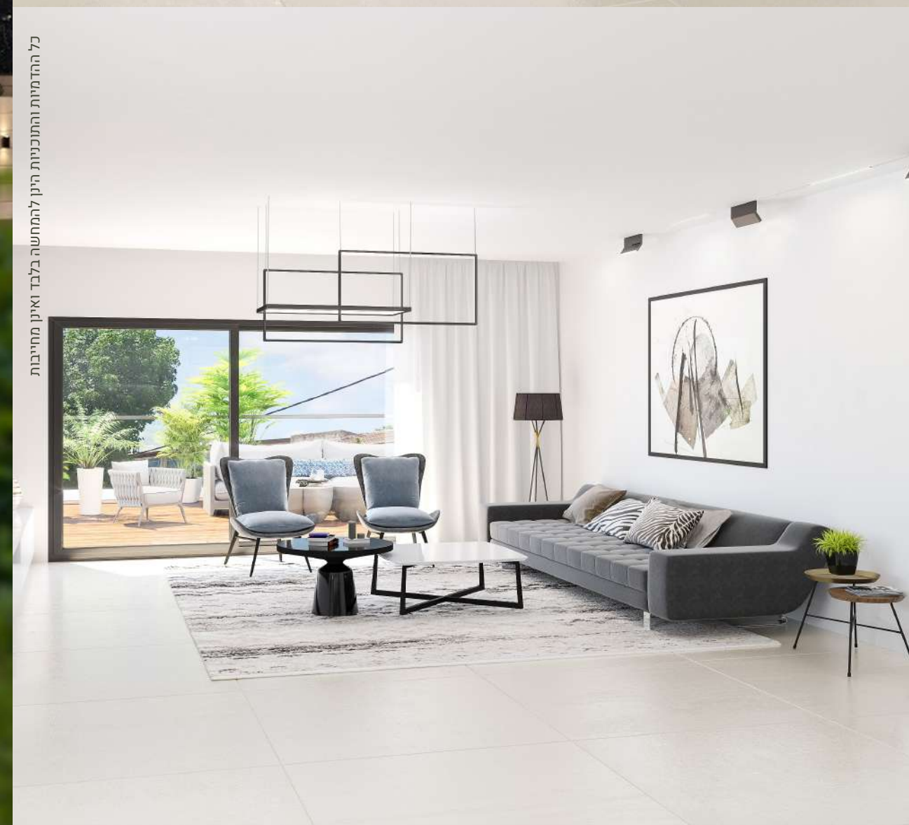
כל ההחלטות והתכנונות הינן לתחשה בלבד ואינן מחייבות